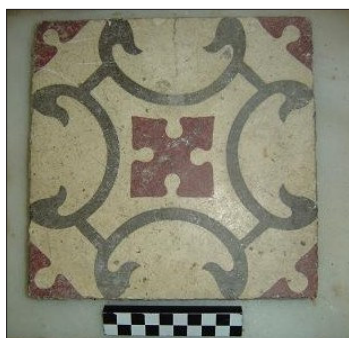
Rajola amb decoració polícroma del paviment modern

Així doncs, podem parlar de diversos paviments hidràulics, alguns de polícroms, que han estat en ús fins abans d'iniciar-hi les obres i que en la major part dels casos cobrien d'altres anteriors de maons o pitxolins ceràmics rectangulars o quadrangulars, de color rogenc i mate, que en general eren lligats amb morter de calç. A sota dels dits nivells de circulació ens hem trobat amb sediments diversos resultants d'abocaments d'anivellació de cara a ubicar-hi els esmentats sòls del que havia de ser la planta baixa de la vivenda i elements emprats, sota dels dits sediments d'anivellació, durant la fase de construcció de l'edifici (1849) que encara avui s'aixeca en el dit indret del número 3 del carrer de Requesens. Amb tot, i atesa la poca rellevància de les restes, atenent a que no ens deixen constància d'ocupacions anteriors a l'actual edificació sita en el dit carrer de requesens, ens limitem a deixar constància fotogràfica dels diversos elements soterrats aquests, com són les clavegueres i els fonaments, així com un nivell de circulació cobert d'una fina capa de