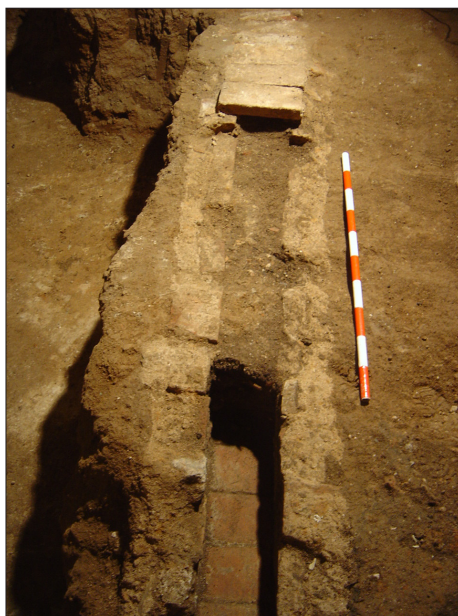
En aquesta imatge veiem una d'aquestes clavegueres inicials, també en desús, encara, parcialment, coberta amb pitxolins i construïda, com em dit, en el retall realitzat al sediment d'anivellació post-construcció de l'edifici.

consisteixen en l'estructura que es recolza a les parets i fons del retall realitzat al sediments de anivellació abans citat, sempre amb inclinació considerable per facilitar el rebuig i la decantació dels residus. Són de secció quadrangular, realitzades generalment amb maons de 30x14 aproximadament. D'altra banda, s'han documentat fotogràficament altres tipus de sistemes de clavegueram ja resultants de reformes més recents, com ara les canalitzacions de secció circular realitzades a partir de tub de formigó de ciment.