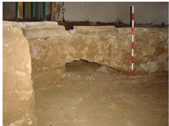
Vista de dues de les fonamentacions internes de l'edifici amb la presència de arcs de descàrrega o reforç. La primera -foto esquerra- correspon a la paret posterior (sud) de la vivenda i la segona - foto dreta - en desús, suporta avui dia el pes de pilars interns.

. Amb tot, per acabar, podem dir que el dit pou o fossa sèptica era ja amortitzat i en desús abans d'iniciar-se l'obra. Així, el sediment era constituït per una deposició o abocament de terres grises amb carbonets.