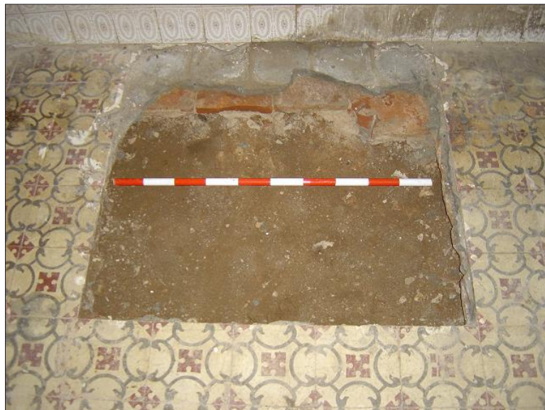
Vista de sediment d'anivellació per la ubicació de l'antic paviment