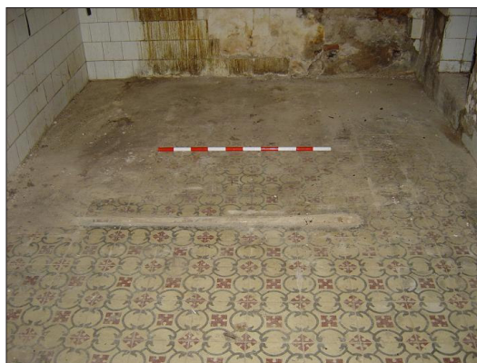
Vista del dit paviment