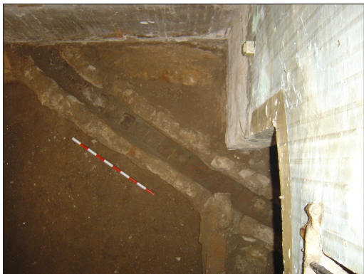
Vista d'una de les clavegueres ja anul·lades de la fase fundacional de l'edifici

calç on s'hi localitza una negativa també recoberta del dit material –calç- que segurament s'hauria emprat com a pastera per realitzar-hi el morter a partir del dit producte, tot plegat adossat ja als fonaments de l'edifici.