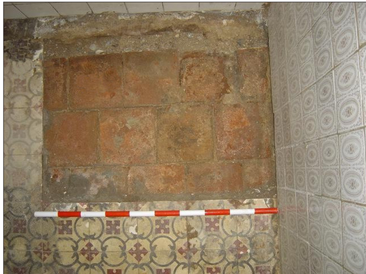
Vista d'un dels paviments antics de la vivenda