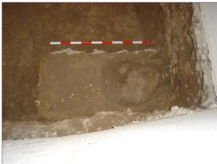
Pastera de calç localitzada i retallada en un nivell de circulació emprat per a la construcció de la vivenda