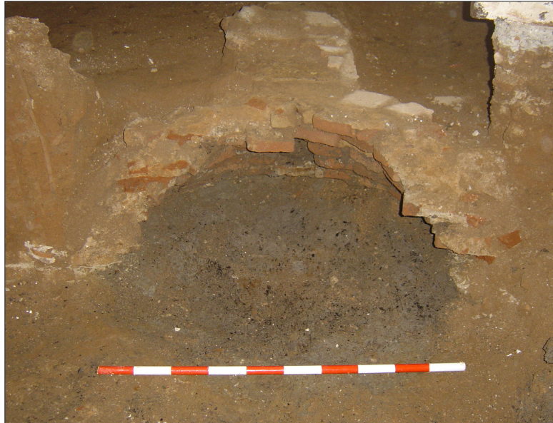
Vista de la fossa sèptica seccionada i, al fons, d'una de les clavegueres que hi abocava els residus

També hem pogut documentar la presència d'una fossa sèptica de planta circular on hi arribaven els residus de dues de les clavegueres de la vivenda. La profunditat d'aquesta no l'hem pogut esbrinar, només podem dir que tenia aparell constructiu de maó a la seva part superior, constituint el sostre o cobertura de la mateixa en forma de petita cúpula. D'altra banda, la resta del contenidor - les parets i, segurament, el